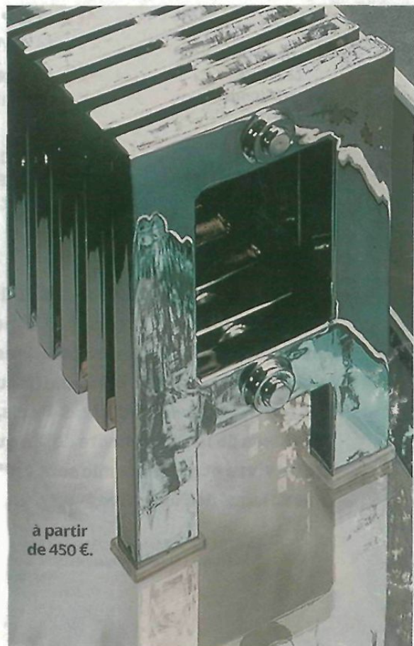
à partir de 450 €.

Varéla Design, Romorantin-Lanthenay 02 54 76 85 19 varela-design.com